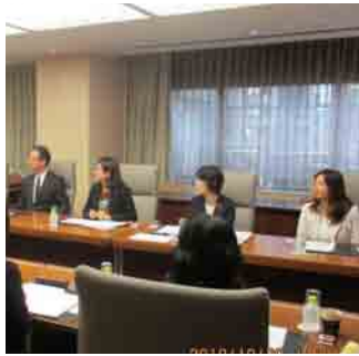
全国郵便局長夫人会役員会(10月30日)