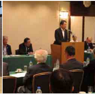
郵政政策研究会合同会議(8月29日)