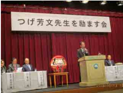
柘植先生総決起集会 (信越地方会「新潟県」)

結び、本年が皆さまにとりましては佳き一年となりますようご祈念申し上げます。新春のご挨拶といたします。