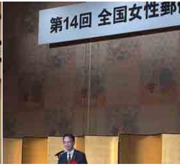
全国女性局長の集い近畿大会(10月6日)