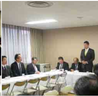
党政調、総務部会関係合同役員会(11月12日)