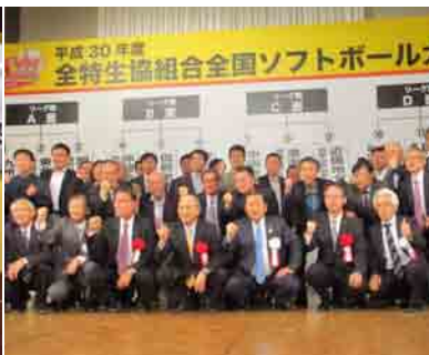
全特生協ソフトボール大会 前夜祭(10月26日)