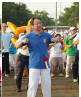
1000万人ラジオ体操・みんなの体操祭(8月5日)