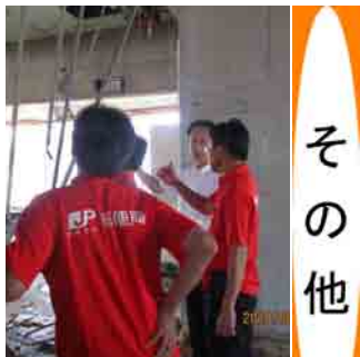
西日本豪雨で被災した箭田郵便局訪問(8月4日)