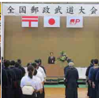
全国郵政武道大会(9月23日)