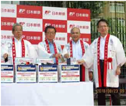
日本郵便 オリ・パラ応援イベント

お陰さまで、参議院議員として三年目を迎え、参議院財政金融委員会、消費者問題特別委員会等における質疑や、党の部会、税調等の場で、郵便局、郵政事業に関する発言をさせていただき、常に支えたいと願っている皆さまの熱い思いを形にすべく今後とも議員活動に邁進して参ります。