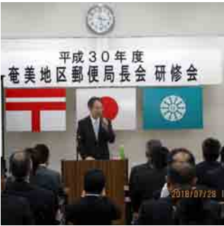
奄美地区会研修会(7月28日)