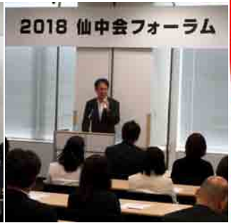
2018 仙中会フォーラム(7月21日)