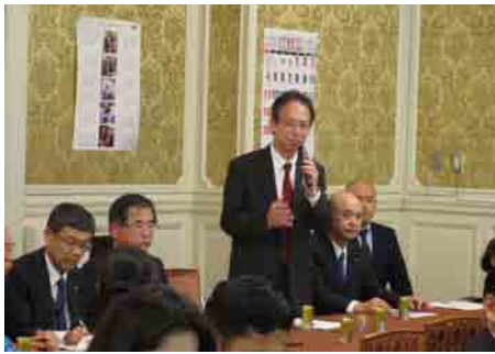
参議院自民党政策審議会で全国郵便局長会等から御要望をお聞きする

自由民主党東京都参議院 比例区第54支部 住所：〒100-8962東京都千代田区永田町2-1-1 参議院議員会館424号室 電話：03-6550-0424 FAX：03-6551-0424 http://tokushige-m.jp/