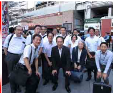
自民党総裁選街頭演説会(9月19日)