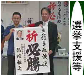
沖縄県知事選挙・那覇市長選挙応援(9月14日)