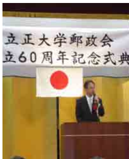
立正大学郵政会 創立60周年記念式典(11月3日)