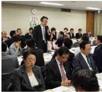
保険制度改善推進議員連盟総会(11月12日)