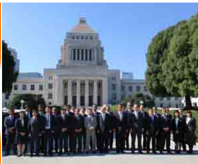
横浜東部地区会国会見学(10月29日)