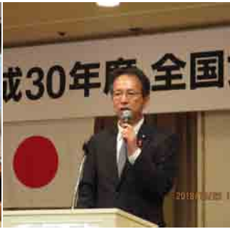
平成30年度全国女性会員代表者研修(10月26日)