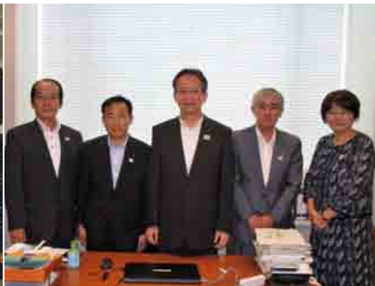
全国簡易郵便局連合会三役挨拶(8月24日)