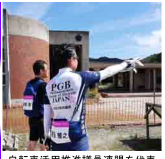
自転車活用推進議員連盟を代表して「ツールド・東北2018」に参加(於:石巻・大川小学校)