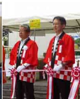
魚沼物産展(於:旧日本郵政ビル前、8月23日)